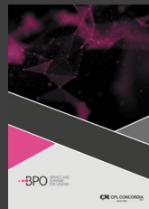
BPO - Business Process Outsourcing