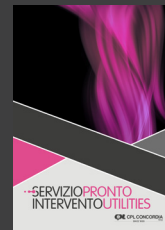
Servizio di Pronto Intervento per le Utilities