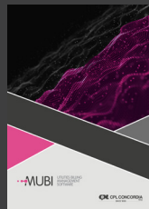
MUBI - Utilities billing management software